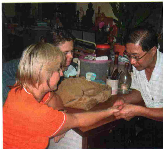
Kinų gydytojo pamokose

Gimusiems jaučio, ožkos ir šuns metais patartina pasitikrinti sveikatą. Gimusiems drakono metais reikia kuo mažiau sėdėti namuose. Jiems šie metai bus konfliktiški, to išvengti padės judėjimas.